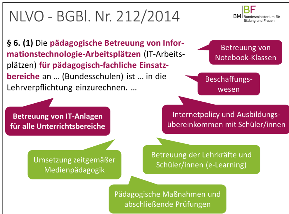
Abbildung 3: technische, organisatorische und pädagogische Zuständigkeiten gem. § 6 (1) NLVO für IT-Manager/innen

Ein/e IT-Manager/in (IT-Kustod/in) kann und soll durch IT-Betreuer/innen von Routinetätigkeiten der Hardwarebetreuung entlastet werden , teilt sich dies selbständig im Rahmen seiner/ihrer Führungsfunktion als Fachvorgesetzte/r ein, und bleibt davon unberührt für den pädagogischen Bereich der IT-Betreuung verantwortlich (die Verantwortung kann nicht delegiert werden).